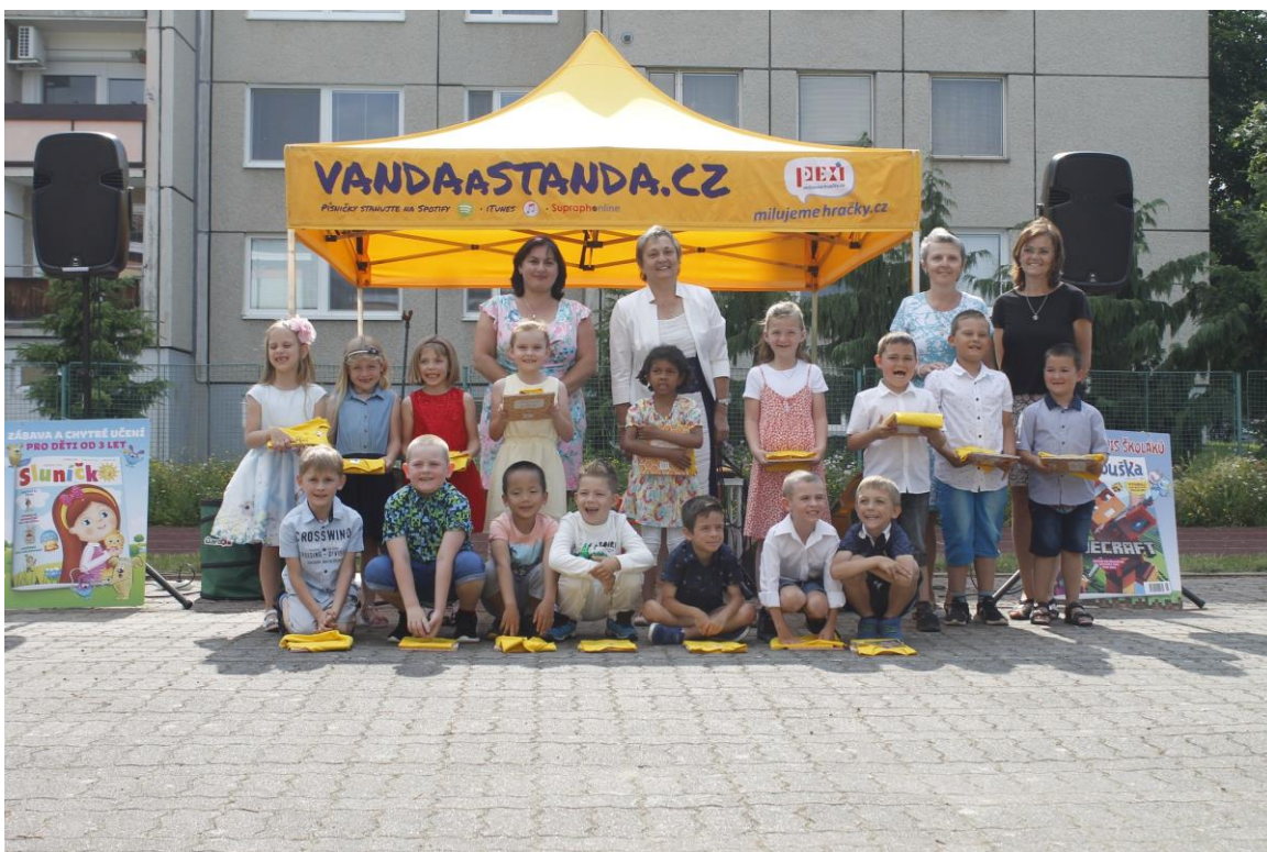
Pasování předškoláků – 2022/2023