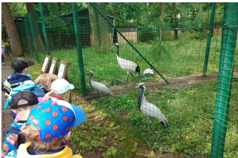
Na výletě v ZOO Hodonín