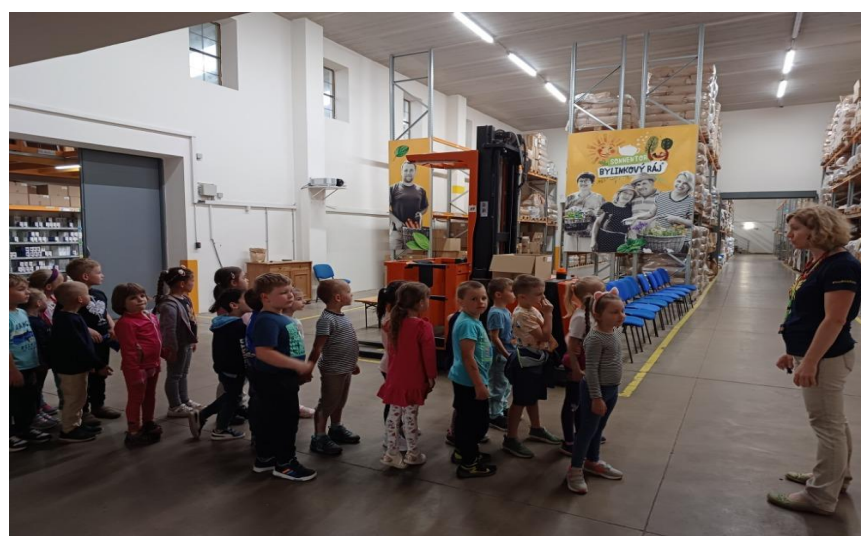
Exkurze v Sonnentoru v Čejkovicích