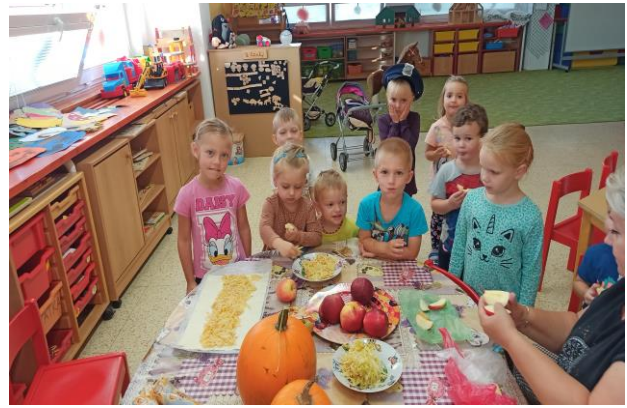
Pečeme štrúdl a tvoříme ovocné špízy