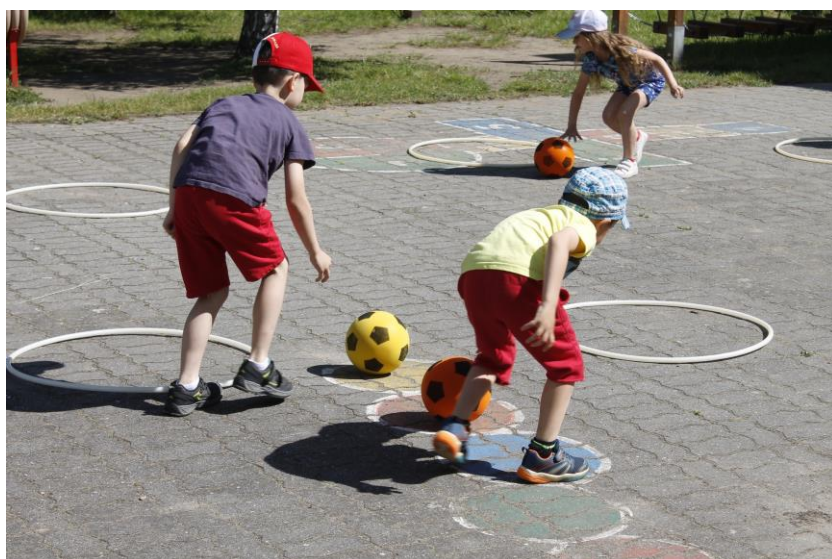
Miniolympiáda mateřských škol