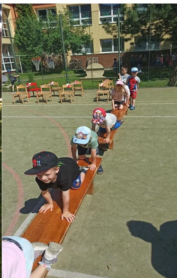
Dětský den – užili jsme si to