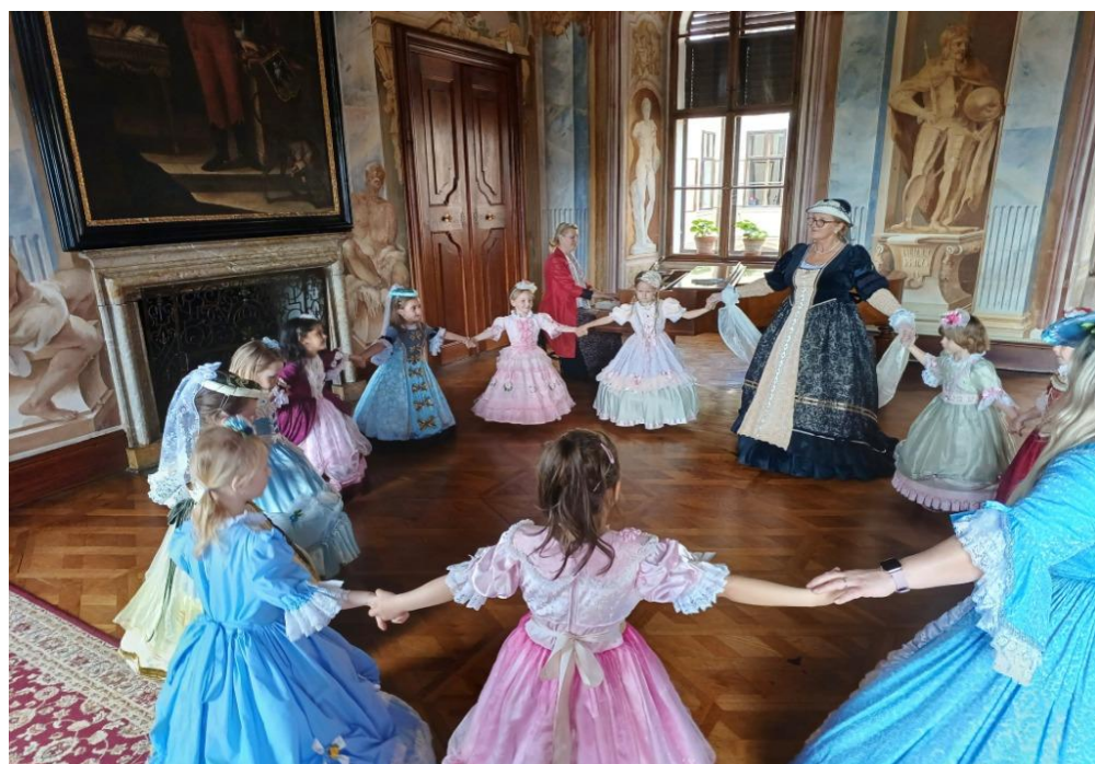
Milotice – zámecké paní, pánové